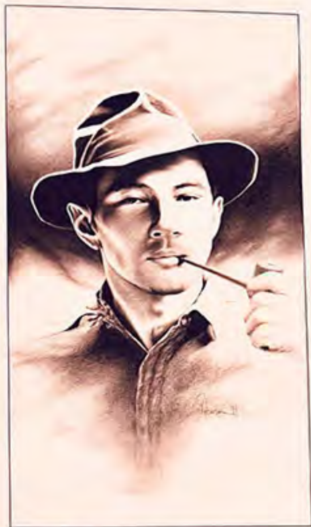
Douglas, 1999 Graphite & Ink

About Art Magazine: How long have you been working as an artist?