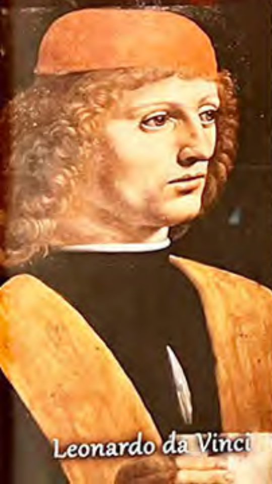
Leonardo da Vinci