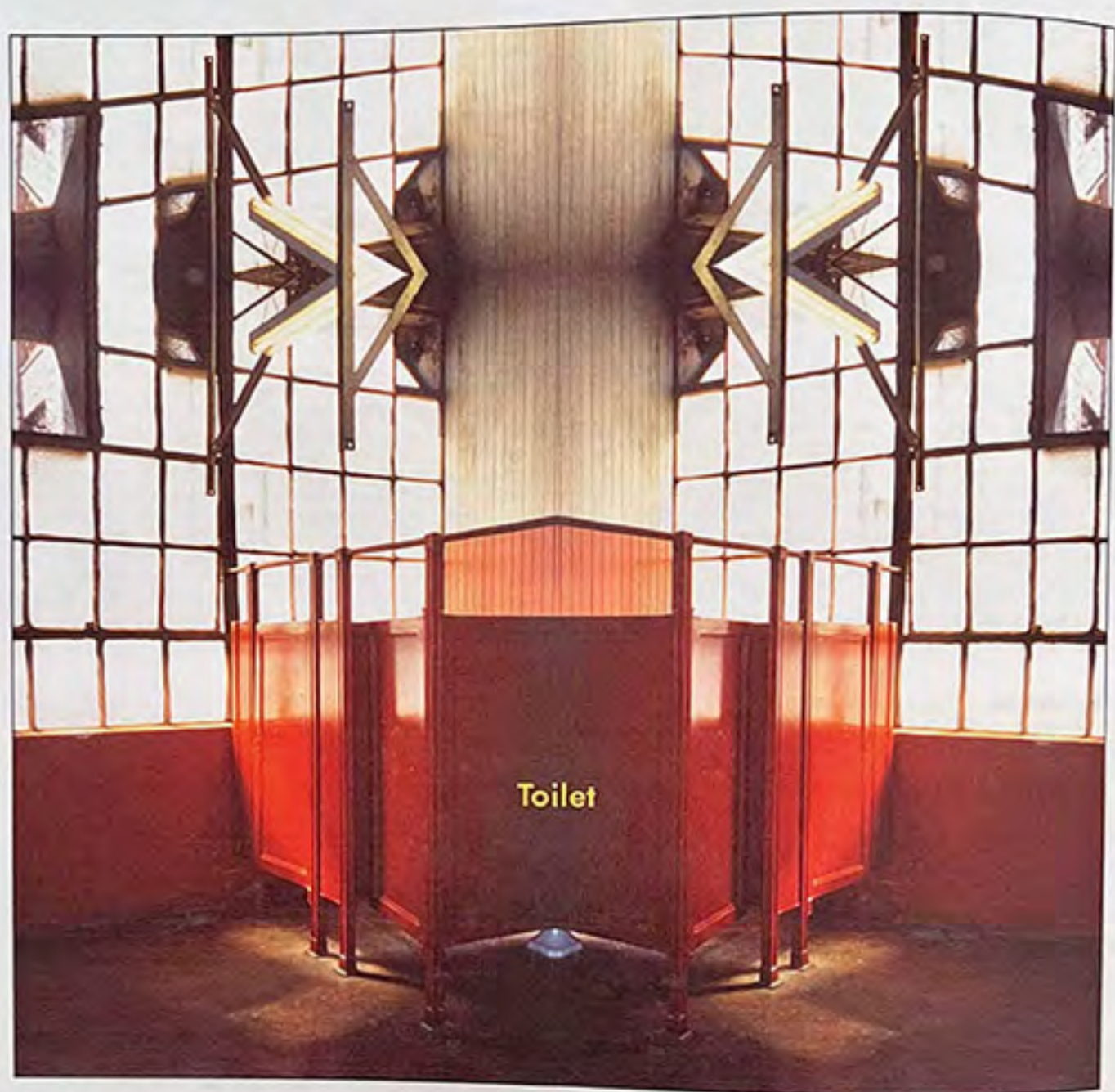
Toilet, 2001 (an homage to Marcel Duchamp)