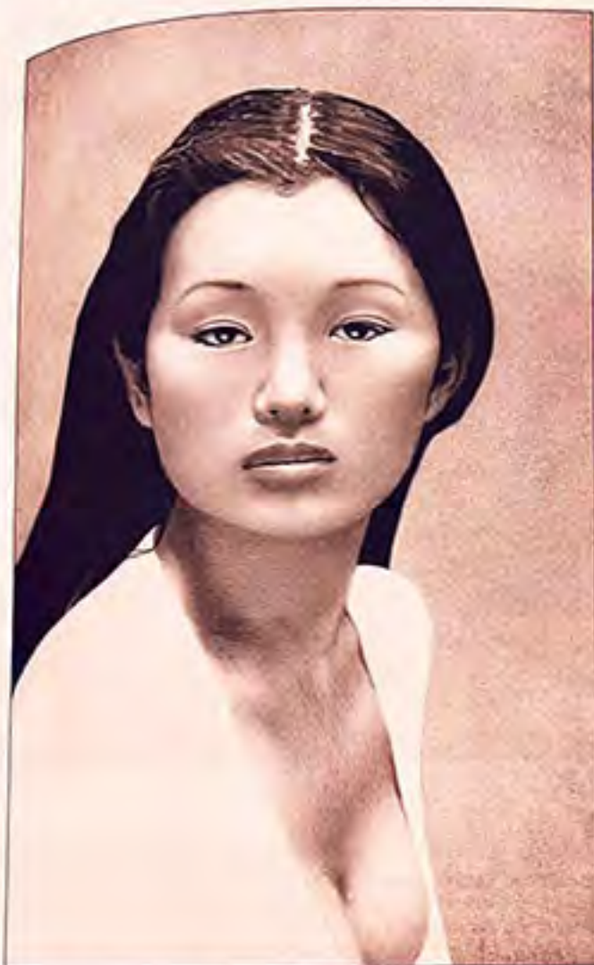
Gong Li, 2009 Graphite, Ink & Spray Paint