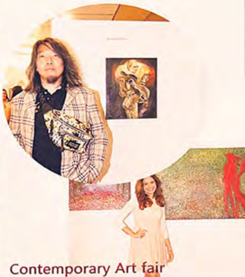
Contemporary Art fair in Paris 56